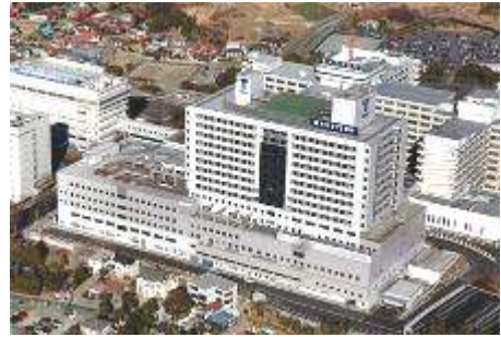
東海大学医学部付属病院

10月31日(土)、東海大学医学部付属病院で、9:00から「付属高校生一日看護体験学習」が行われました。本校から7名(男子2名、女子5名)の生徒が参加しました。当日は、9:00からオリエンテーションが行われ、9:30から脳神経外科、救命救急、小児科等で看護体験学習を行いました。午後からは病院内施設見学の後、意見交換会が行われました。