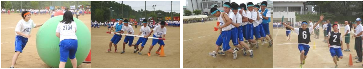
＜3学年 優勝7組・準優勝8組・3位1組＞