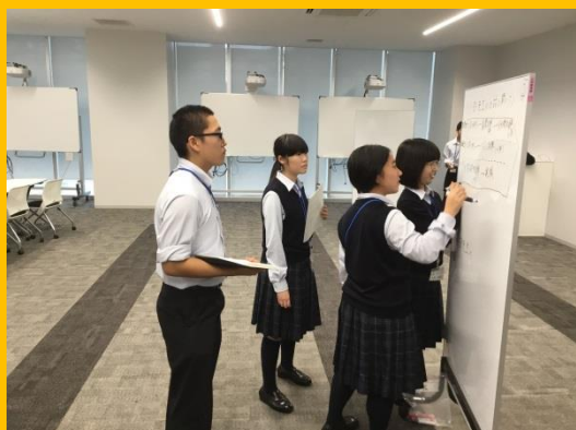
グループワークと発表